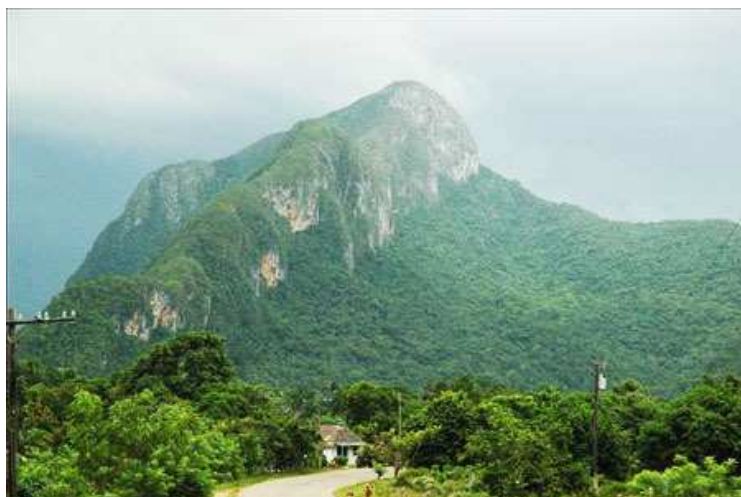
Mil cumbres Fernandina ou Cuba ?

Suite à de regrettables erreurs, l'Île apparaît sous le nom d'Isabela dans plusieurs cartes du XVI ème siècle comme le signale J. J. Arrom. Toutefois, le nom « Cuba » a été maintenu sur les deux plus importantes cartes de l'époque : celle du cartographe Juan de la Cosa en 1500 et celle du chroniqueur à la cour du roi Pedro Mártir de Anglería en 1511.