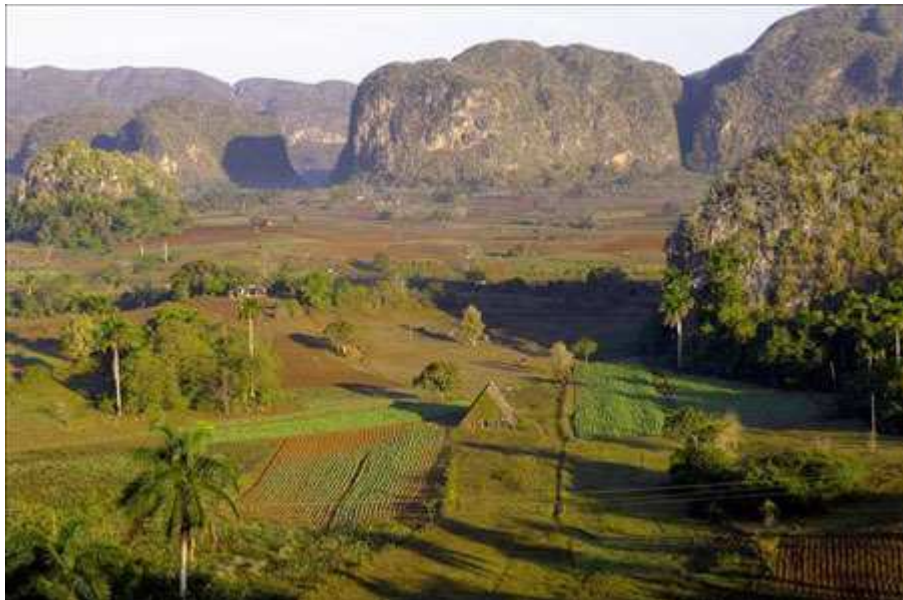
Vallée de Viñales

Mais le nom de Cuba a triomphé au terme des années. On trouve des explications du fait que les créoles ont voulu petit à petit se différencier de la communauté espagnole afin de s'exprimer en leur nom propre.